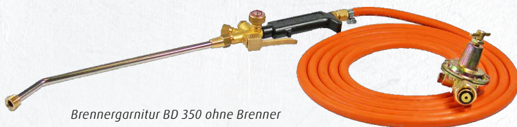
Brennergarnitur BD 350 ohne Brenner