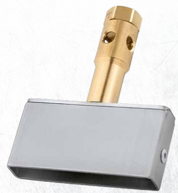
Super-Turbo-Brenner BD komplett