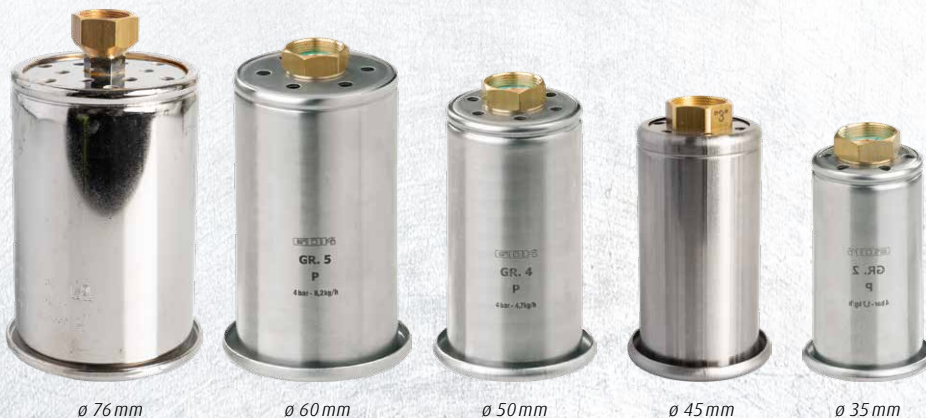
ø 76 mm