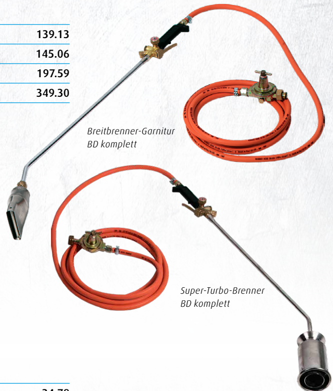
Breitbartbrenner-Garnitur BD komplett