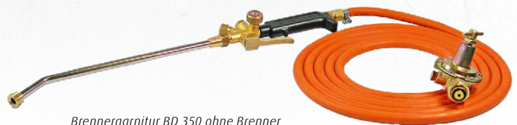
Brennergarnitur BD 350 ohne Brenner